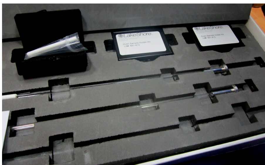
Держатель для VSM магнетометра